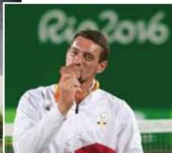
Joachim Gérard parrain d'Escalpade

Médaillé de bronze aux Jeux Paralympiques de Rio 2016